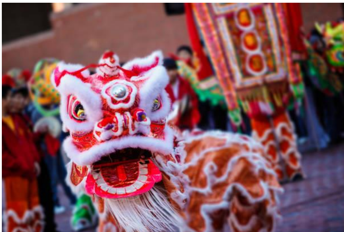
Légende de l'image : La danse du lion prise par le photographe Wei

Le Nouvel an lunaire ou chinois est également appelé la fête du Printemps. En effet, le printemps est caractérisé comme la saison où la nature se réveille avec les bourgeons qui éclosent, les fleurs qui embellissent parcs et jardins de belles couleurs. La date du nouvel an se situe entre mi-janvier et mi-février. C'est à cette période que la vie réapparaît après l'hiver. Ce nouveau nom de Fête du Printemps est tout de même 'récent' puisqu'il est utilisé seulement depuis 1912. Cette année-là, la Chine passe du calendrier luni-solaire traditionnel au calendrier grégorien (le nôtre). Cependant, les festivités chinoises se fixent encore sur le calendrier traditionnel.