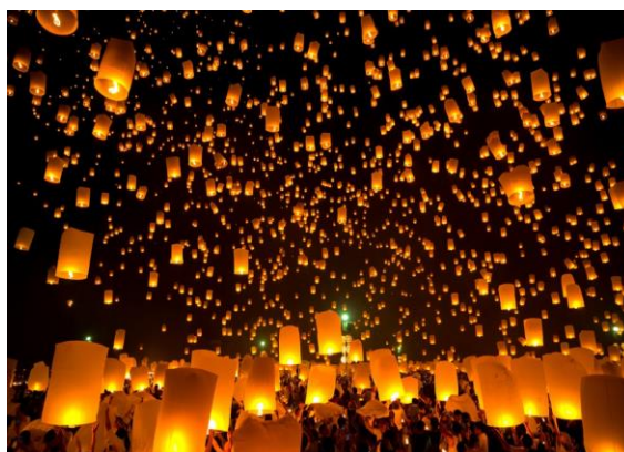
Légende de l'image : La fête des lanternes prise par le photographe Wei

Sources : https://www.nationalgeographic.fr/