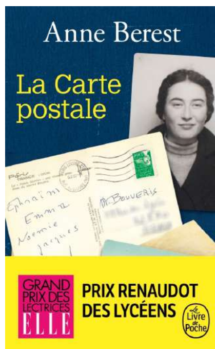
Berest Anne, La carte postale , Grasset, (Roman), 2021.